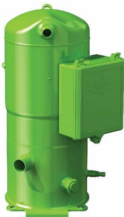
Bild 2: In der BITZER Software können nun auch ORBIT, ORBIT+ und ORBIT FIT Scrollverdichter (hier: ORBIT FIT) für den Betrieb mit externen Frequenzumrichtern berechnet werden